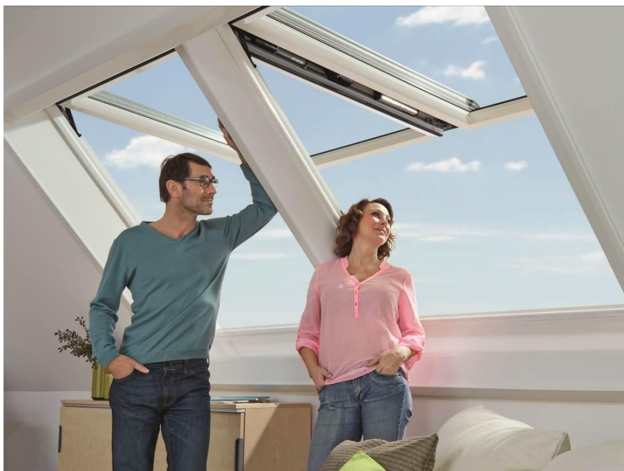
Комфорт дистанционного управления – новое окно RotoComfort i8

Окно RotoComfort i8 полностью совместимо с KNX (мировой системой автоматизации оборудования и зданий) и с системой Rotomatic, благодаря чему оно может быть интегрировано с другими устройствами Roto на дистанционном управлении.